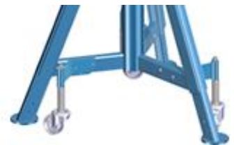
Pyöräsarjat lyhyessä pukissa.