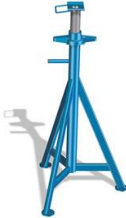
Lyhyt akselipukki A009100A0