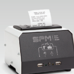
SPM : Tulostinmoduuli 026919