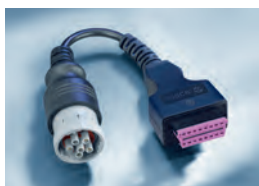
US-protokolla 6-napainen 1 684 463 789