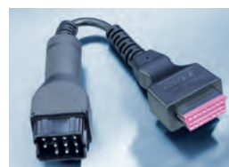
Renault VI 1 684 463 773