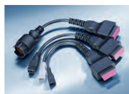
Kaapelisarja pakettiautoille 1 687 001 947