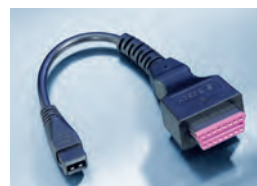
Citroën/Peugeot Boxer 1 684 463 788