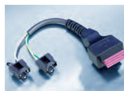
ABS Modul 1 1 684 463 778