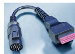
Iveco 1 684 463 774