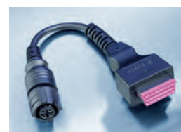
ABS Modul 2 1 684 463 779