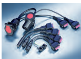
Kaapelisarja perävaunuille 1 687 001 945