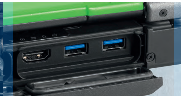
2 USB 3.0 liitäntää