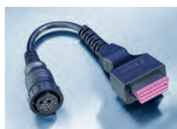
DAF & Scania 1 684 463 776