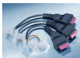
Kaapelisarja linja-autoille 1 687 001 946