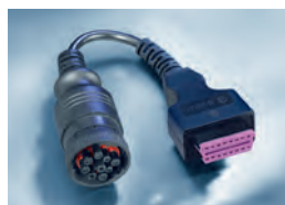
US-protokolla 9-napainen 1 684 463 790