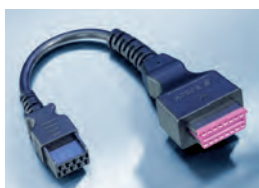
Volvo 1 684 463 770