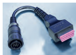
MB 14-napainen 1 684 463 772