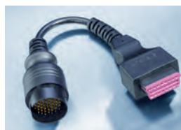
Iveco Daily 1 684 463 786