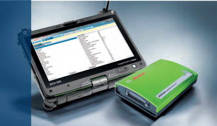
KTS 900 Truck: yhdistelmä DCU 220 ja KTS Truck

Eryteisesti korjaamokäyttöön suunniteltu kestävä DCU 220 ohjaa kaikkia Boschin testaus- ja diagnoosijärjestelmiä, esimerkiksi FSA 500:aa.