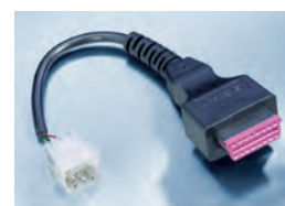
ECS Volvo Bus 1 684 463 784