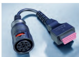
MAN TG (pyöreä pistoke) 1 684 463 775