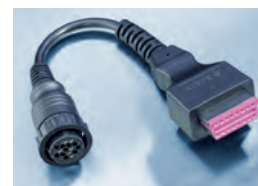
Scania 1 684 463 793