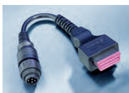
Wabco/Knorr ABS/EBS 1 684 463 780