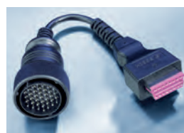
MAN Series 2000 1 684 463 777