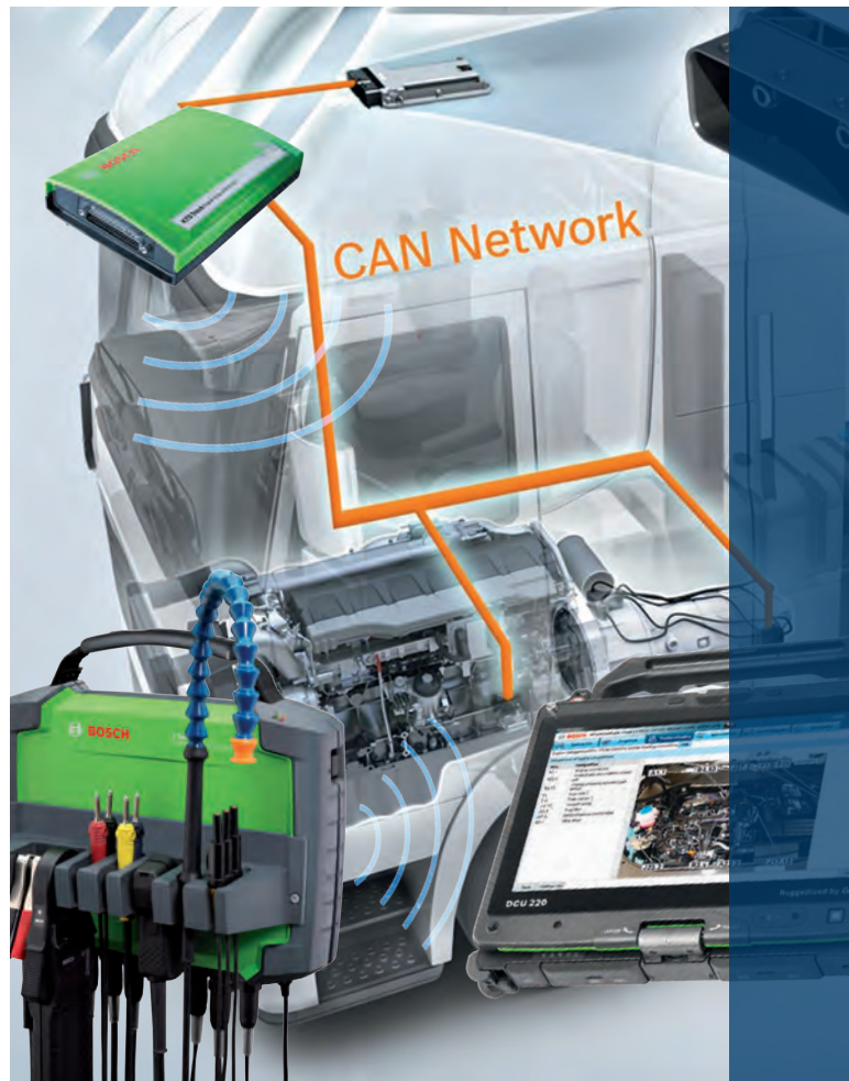
Modulaari konsepti Bluetooth-yhteydellä