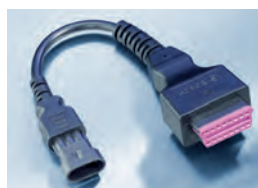
Iveco 3-napainen 1 684 463 771