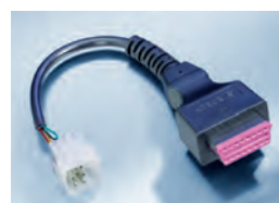
ABS Volvo Bus 1 684 463 783