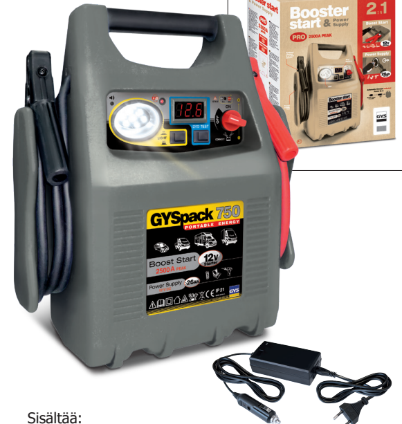
Sisältää: - Automaattinen laturi 12 V (tuotenro 054684)